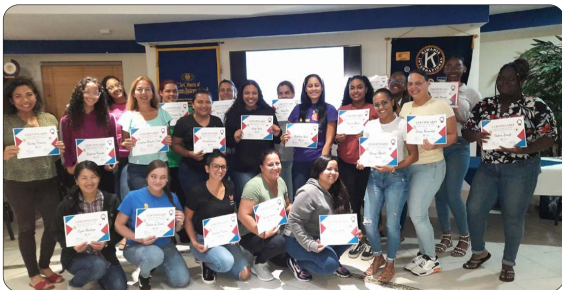
Grupo 2: Brighter Future, Carousel Speelschool, De kleine Rups, Harvard Kids, Little Stars, Little Zoo, YMCA Aruba